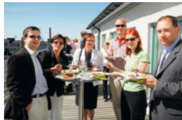
Suvipäivän vieraat nauttivat terassilla alkukesän lämmöstä ja Etelä-Helsingin näkymistä.

Erään tutkimuksen mukaan vakuutusmyyjä, joka saa kieltävän vastauksen ja sen seurauksena pitää itseään huonona, stres-