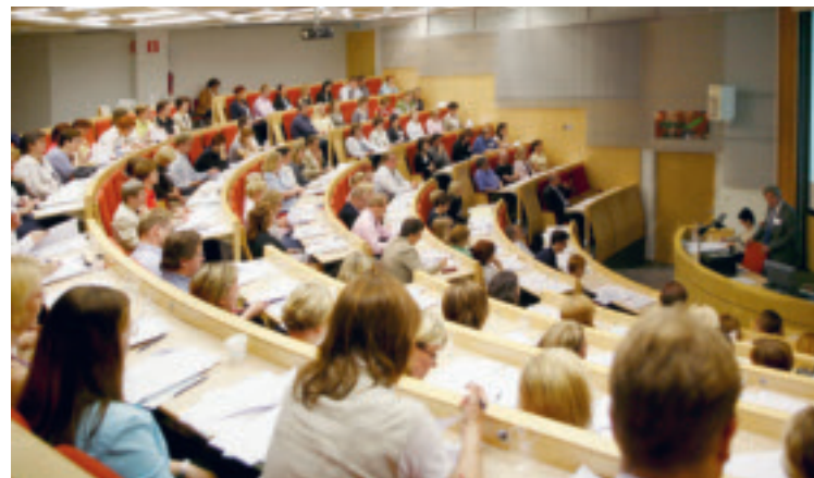
TVL:n ja LVK:n yhteinen Ajankohtaispäivä 29.5. kokosi satapäisen kuulijakunnan.

Liikennevakuutuslain kokonaisuudistus sekä tapaturmavakuutus- ja ammatitilainsäädännön uudistamistyö ovat merkittäviä, laajoja hankkeita, joiden tiimoilta tulee olemaan LVK:n, TVL:n ja FINVA:n yhteistä koulutusta. ■